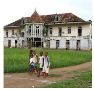
Roca Boa Entrada

Colazione in hotel e visita di ROCA BOA ENTRADA e ROCA AGOSTINHO NETO, dove potremo vedere numerosi edifici coloniali come l'ospedale, la casa padronale e le sanzalas, dove tuttora abitano i lavoratori. Pranzo in un ristorante e proseguimento a SANTANA, dove effettueremo un'escursione in barca all'Ilheu Santana, di origine vulcanica, dove è facile incontrare i pescatori artigianali all'opera. Rientrati sulla terraferma partiremo in direzione sud verso Porto Alegre, con una sosta al punto panoramico dove ammirare il PICO CAO GRANDE, un monolite di basalto alto 800 metri e simbolo del paese. Arrivo all'Eco-hotel Praia Inhame o similare, adagiato su un'incantevole spiaggia orlata di palme, cena libera e pernottamento in bungalow doppio con servizi.