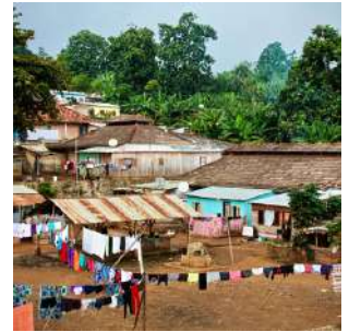
Villaggio di Agostinho Neto