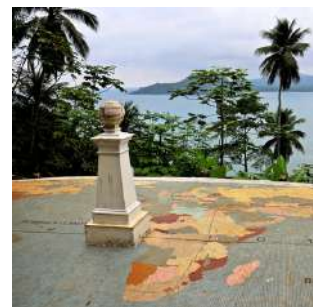
Il marcatore dell'Equatore a Las Rolas

Colazione in hotel e mattinata dedicata alla scoperta della zona meridionale dell'isola e delle due spiagge più famose di Sao Tomè, PRAIA PISCINA e PRAIA JALE'. Troveremo spiagge assai differenti, alcune di sabbia bianca finissima, bagnate da acque cristalline, altre di sabbia nera e scogli, dal fascino tutto particolare. Pranzo in un ristorante e pomeriggio dedicato al relax balneare o possibilità di trekking (circa 2 ore) in una lussureggiante vegetazione. Cena libera e a seguire escursione notturna per l'avvistamento delle tartarughe marine dove, con un po'di fortuna, assisteremo all'incredibile corsa verso il mare delle tartarughe appena nate. Pernottamento in bungalow doppio con servizi.