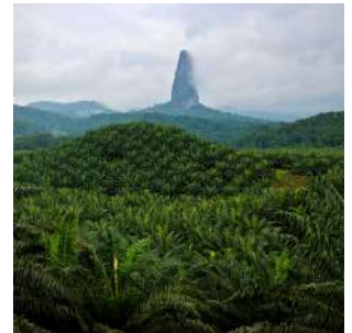
Pico Cao Grande

Colazione in hotel ed escursione in barca verso ILHEU LAS ROLAS, un fazzoletto di terra a poche decine di metri dalla costa, situato verso il "centro del mondo", latitudine 0 e longitudine 0, dove la terra si divide tra emisfero settentrionale e meridionale e si trova il marcatore dell'Equatore. Passeggiata a piedi nell'isola attraverso le piantagioni di palme da cocco per ammirare le spiagge selvagge della costa sud. Pranzo a base di pesce sulla spiaggia, e pomeriggio dedicato al relax balneare sulla magnifica Praia Café. Rientro sulla terraferma, cena libera e pernottamento in bungalow doppio con servizi.