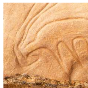
Incisione a Ait Ouazik

Colazione e a seguire ci addentreremo nelle GOLE DEL DADES, caratteristiche per i suoi pendii calcarei scoscesi e le rocce erose. Ci sposteremo poi verso il sito di AIT OUAZIK, dove osserveremo le incisioni rupestri realizzate su decine di lastre di pietra. Quest'arte preistorica rappresenta principalmente la fauna dell'epoca, quando il Sahara era una savana verdeggiante: elefanti, antilopi, rinoceronti, giraffe, felini... Continueremo la giornata raggiungendo uno degli esempi più belli di architettura del sud, lo ksar di TAMNOUGALTE, arroccato su una collina ed uno dei più antichi del Marocco. Questo villaggio in rovina, fatto di edifici decorate con pareti in bugnato e torri affusolate, era la capitale della regione e il jema, costituito dalle famiglie riunite, amministravano la repubblica indipendente. Pranzo e cena liberi, pernottamento al Riad Dar Amazir o similare, in camera doppia con servizi.