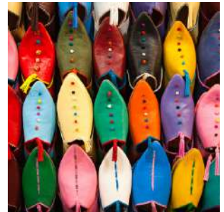
Babouce in vendita nel souk

Colazione e giornata interamente dedicata alla visita della città imperiale di MARRAKECH, da sempre centro di scambi commerciali, luogo d'incontro tra i membri delle tribù e gli abitanti dei villaggi berberi. Chiamata anche la "città rossa" per via dei pigmenti naturali che adornano i suoi edifici è divisa in due parti: l'antica medina, fondata nel medioevo dal sultano Youssef Ben Tachfine, e la Ville Nouvelle coloniale, realizzata dai francesi nella metà del XX secolo. Il cuore della medina è la piazza Jemaa el Fnaa dalla quale scorgere l'inconfondibile minareto della Koutubia, classico esempio di architettura almohade. Tra i monumenti degni di nota la Madrasa Ben Youssef, con i suoi stucchi, le decorazioni zellij e gli intagli in legno di cedro, il Palazzo Bahia, l'ideale dell'architettura araba in un palazzo dell'Ottocento, e il jardin Majorelle, un giardino raffinato con cactus, ninfee e un pregevole museo d'arte islamica. Pranzo e cena liberi, pernottamento in riad.