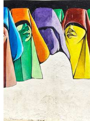
Murales ad Asilah