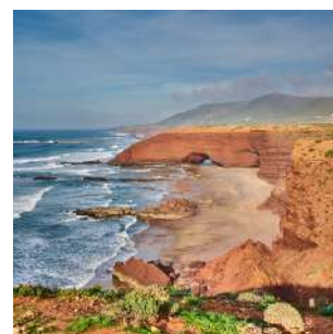
Arco di Legzira

Colazione e passeggiata per le strade di SIDI IFNI, avamposto militare costruito intorno agli anni '30 e appartenente agli spagnoli sino al 1969, quando venne abbandonato. Molti edifici, in parte decadenti, fanno della cittadina uno degli esempi più interessanti di Art Déco. Il cuore della città è Plaza de Espana, oggi Place Hassan II. Trasferimento verso nord con soste per ammirare il grande arco roccioso sulla spiaggia di LEGZIRA (un altro iconico arco crollò sfortunatamente nel 2016) e la cittadina di TIZNIT, circondata da imponenti mura in pisé. Qui potremo ammirare l'architettura della Grande Moschea con un particolare minareto punteggiato da pertiche di legno, che ricorda l'architettura sudanese del Mali, ed altresì il souk dei gioiellieri che lavorano l'argento. Proseguimento ad Essaouira. Pranzo e cena liberi, pernottamento al Riad Zahra o similare, in camera doppia con servizi.