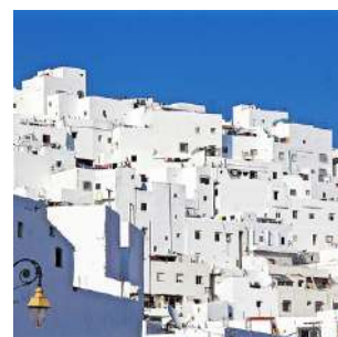
La bianca medina di Tetouan