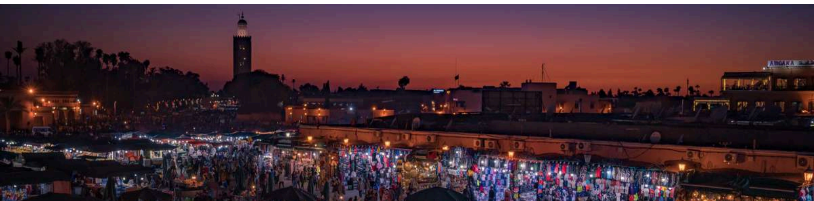
Jemaa el Fna