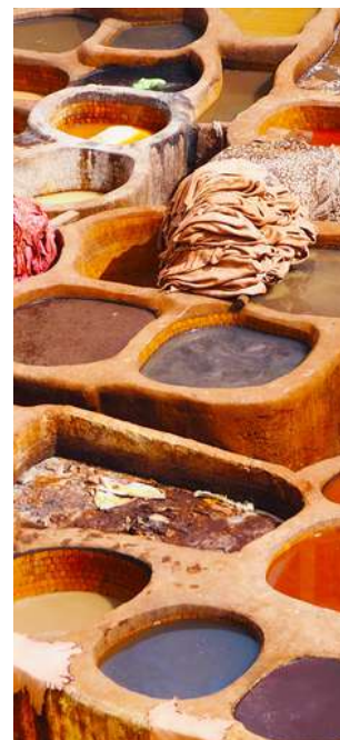
Conerie di Fez

Colazione e trasferimento verso la città di FEZ, la più antica delle quattro capitali imperiali del Marocco. Ci addentreremo nei souk cittadini che si estendono per oltre 1 km conservando la tradizione dell'artigianato urbano. La medina si articola in due parti separate: Fez El Bali (vecchia Fez) e Fez El Jedid (nuova Fez): la prima è un intricato dedalo di vicoli, madrase e souk, mentre la seconda è dominata da una grande area di palazzi reali e giardini. Conosceremo le conerie, vasche per la tintura delle pelli il cui utilizzo non è cambiato dall'epoca medievale. Pranzo e cena liberi, pernottamento al Riad Tara o similare, in camera doppia con servizi.