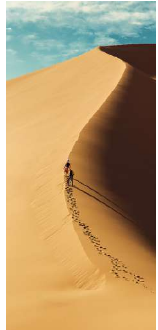
L'immensità del Sahara

Colazione nel campo tendato. Possibilità di ammirare l'alba sulle dune prima di partire per l'oasi di SKOURA, un grande palmeto con un reticolo di sentieri che circonda i guadi e le palme. Qui visiteremo la kasbah Ameridil riccamente decorata, realizzata nel XVII secolo per il caid di Skoura e presente oggi sulla banconota da 50 dirham. Proseguimento per AIT BEN HADDOU, ben nota per i film che vi sono stati girati, come Lawrence d'Arabia di David Lean, Sodoma e Gomorra di Orson Welles, Gesù di Nazareth di Franco Zeffirelli e Il Gladiatore di Ridley Scott. La kasbah, risalente all'XI secolo, si trova su una bassa collina che si erge su un fiume poco profondo con edifici in terra ben elaborati e conservati con torre, merlature e mura a strapiombo. Pranzo e cena liberi, pernottamento alla Guesthouse Bagdad Café o similare, in camera doppia con servizi.