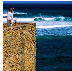
Bastioni di El Jadida

Colazione e mattinata dedicata alla visita di RABAT, con il famoso mausoleo di Mohammed V, ideato da un architetto vietnamita, che si trova dinanzi alla torre di Hassan. A seguire ci trasferiremo ad ASILAH, uno dei più eleganti porti portoghesi sull'Atlantico, con i suoi bastioni squadrati in pietra circondati da palme ed una medina tra le più interessanti del Paese con colori pastello e caratterizzata da murales realizzati per l'International Cultural Festival, un evento che attrae artisti da tutto il mondo. Proseguimento verso la pittoresca cittadina costiera di TETOUAN, situata in cima a un declivio di una grande vallata contro una massa di roccia scura. Visiteremo la medina, tra le meglio conservate del Marocco, dichiarata Patrimonio dell'Umanità dall'UNESCO per la sua architettura tipicamente moresca. Proseguimento verso la "città blu", Chefchaouen. Pranzo e cena liberi, pernottamento al Riad Dar Echaouen o similare, in camera doppia con servizi.