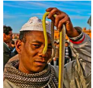
Nella piazza Jemaa el Fna