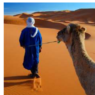
Sulle dune dell'Erg Chebbi

Colazione e giornata di trasferimento durante la quale ci fermeremo nella località sciistica di IFRANE, una cittadina marocchina anomala, con i suoi parchi curati, i laghi e le ville in stile alpino disposte lungo ampie strade alberate. Arriveremo a MERZOUGA in tempo per ammirare il tramonto sulle dune di ERG CHEBBI, alte sino a 150 metri, che segnano il confine con l'Algeria. Pranzo libero, cena e pernottamento in campo tendato fisso con bagni privati esterni.