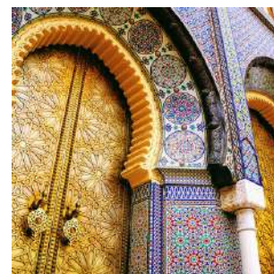
Porta imperiale a Meknes