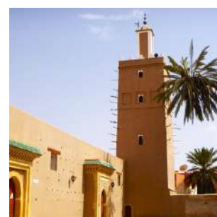
Moschea di Tiznit