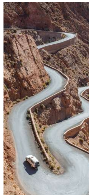
Gole del Todra

Colazione nel campo tendato. Possibilità di ammirare l'alba sulle dune prima di partire per RISSANI ed immergerci nel suo famoso souk ed il tradizionale mercato settimanale degli animali. Ripresa la marcia ci dirigeremo verso le scenografiche GOLE DEL TODRA, uno spettacolare canalone che attraversa l'Alto Atlante con pareti rocciose che cambiano colore a seconda della luce del giorno. Proseguimento in direzione delle Gole del Dades. Pranzo e cena liberi, pernottamento all'Hotel Kasbah Amazir o similare, in camera doppia con servizi.