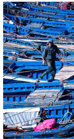
Porticciolo di Essaouira