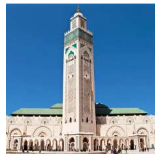
Moschea di Casablanca