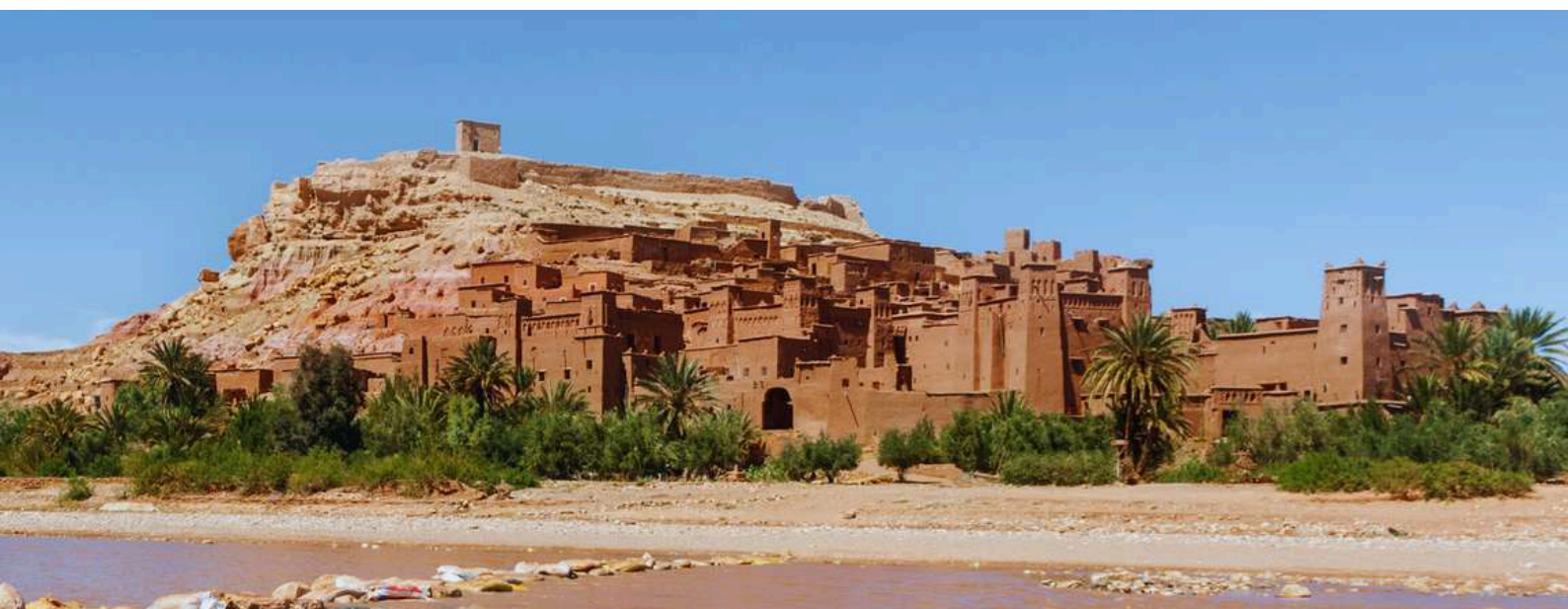
Ait Ben Haddou