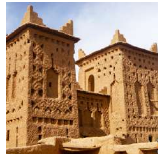
La kasbah Ameridil di Skoura