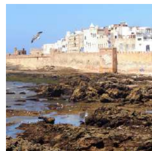
Cittadina di Essaouira

Colazione e giornata interamente dedicata alla visita della cittadina di ESSAOUIRA, l'antica Mogador portoghese, caratterizzata da case imbiancate con imposte blu e colonnati, gallerie d'arte e laboratori di falegnameria, ed un porto pittoresco colorato dalle barche blu dei pescatori. Visiteremo i bastioni, la medina, e ci perderemo tra i suoi vicoli pieni di negozi di artigianato di qualità. Pranzo e cena liberi, pernottamento in riad.