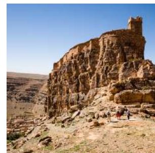
Granaio fortificato di Amtoudi