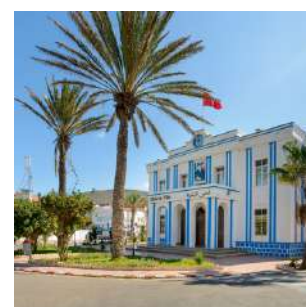
Architettura coloniale spagnola

Colazione e visita di TAFRAOUTE, una cittadina suggestiva costituita da più villaggi in pietra nel bel mezzo di grandi conformazioni rocciose dalle forme disparate. Un percorso panoramico ci condurrà alla piccola AMTOUDI per conoscere il suo agadir, uno straordinario granaio fortificato con bastioni e torri, raggiungibile a piedi o a dorso d'asino tramite un ripido percorso a zigzag. Ci dirigeremo quindi verso la costa atlantica, alla città coloniale spagnola di Sidi Ifni. Pranzo e cena liberi, pernottamento alla Maison d'hote Logis La Marine o similare, in camera doppia con servizi.