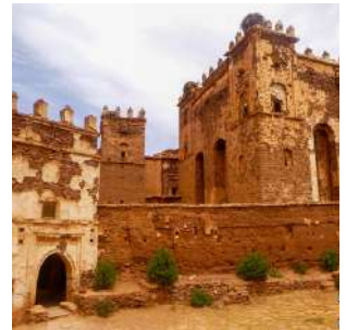
Kasbah del Glaoui a Telouet

Colazione e partenza verso la kasbah di TELOUET, un vasto complesso di edifici abbandonati nel 1956 appartenenti alla leggendaria famiglia Glaoui, i più grandi e ambiziosi tra i capi tribali. Gli edifici stanno sprofondando lentamente della terra rosso-bruna ma il sito rappresenta uno dei monumenti più scenografici della catena dell'Atlante dove sono ancora ben visibili i saloni finemente decorati. Percorreremo i panoramici tornanti del passo di Tizi n'Tichka (N9) che ci condurranno a MARRAKECH dove per la prima volta ci immergeremo nelle atmosfere della piazza Jemaa el Fna, con incantatori di serpenti, musicisti, artisti di strada e, dal tramonto, chioschi mobili dove assaggiare la cucina marocchina. Pranzo e cena liberi, pernottamento al Riad Dar Khmissa o similare, in camera doppia con servizi.