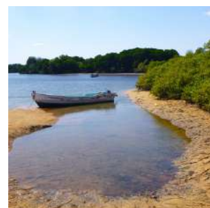
Habitat della mangrovia a Godoria

Dopo la colazione trasferimento ad OBOK, cittadina da cui partì il colonialismo francese e che conserva vestigia dell'epoca come la casa del governatore ed il cimitero della Marina. Visita altresì del faro di RAS BIR e della splendida zona di mangrovie di GODORIA, dove effettueremo un'escursione in barca. Pranzo con lunch box e rientro a Tadjoura. Partenza in traghetto (circa 1h00) attraverso il golfo fino a raggiungere la capitale (gli orari sono aleatori, in caso si rientrerà via terra). All'arrivo nella capitale sistemazione all'Hotel Menelik o similare, cena in un ristorante e pernottamento in camere doppie con servizi.