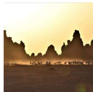
Tramonto sui camini del lago Abbé