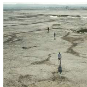
Paesaggi surreali del lago Abbé