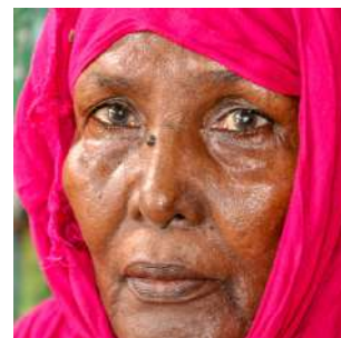
Per le vie del quartiere africano