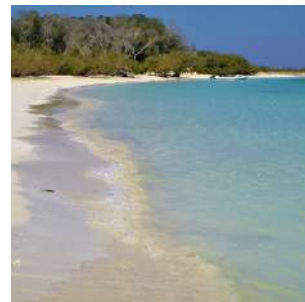
Spiaggia nell'isola di Moucha