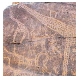
Incisioni di Abourma

* Chi non volesse effettuare il percorso a piedi, potrà dedicarsi alla scoperta dei dintorni di Bankoualé con gli autisti.