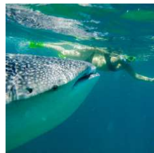
Snorkeling con gli squali balena