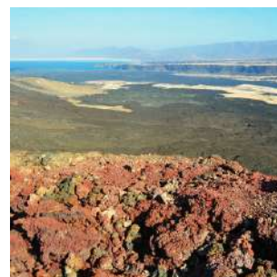
Zona vulcanica dell'Ardoukoba

Dopo la colazione, esplorazione della zona di GHoubbet, con punti panoramici mozzafiato. È proprio in quest'area che i tre grandi sistemi di fratture della crosta terrestre si incontrano (Mar Rosso, Golfo di Aden e la grande Rift Valley africana). Al suo centro, compresa tra il lago Assal e il mare, c'è una fossa che sprofonda, legata ad un allargamento delle fratture che ha generato una zona vulcanica attiva dove si trova il VULCANO ARDOUKOBA formatosi nel 1978. L'attività vulcanica ha lasciato presenti numerose testimonianze come vari coni di scorie, formazioni e tunnel di lava che andremo ad esplorare. Pranzo pic nic e proseguimento verso i MONTI GODA, sistemazione al Campement du Day. Cena e pernottamento al Campement, in capanne tradizionali dotate di letto, docce e bagni in comune.