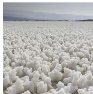
Evaporiti sul Lago Assal