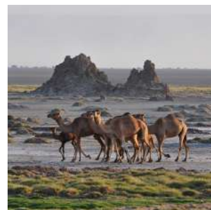
Incontri sul Lago Abbé