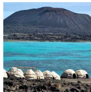
Ghoubbet e l'isola del diavolo