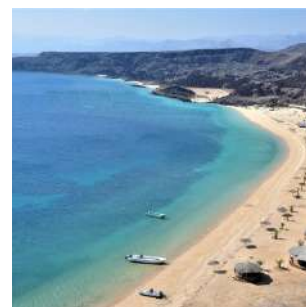
Plage de Sable Blancs