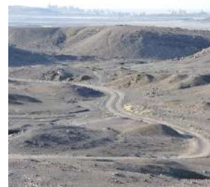
La "luna sulla terra"