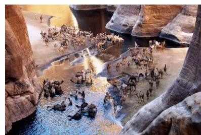
Guelta di Archei