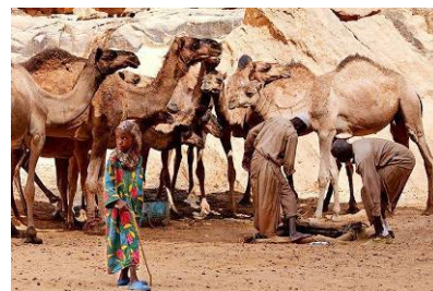
Nomadi Gaeda con i loro dromedari